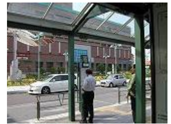
【南海バス和泉中央駅前5番乗り場】

和泉中央駅バス乗り場5番から 研究所方面へのバスが出ております 和泉中央駅発バス 行先:[3]テクノステージ・和泉商工会議所 時刻 13:24 13:54 (毎時 24分、54発) → (所要時間 約7分) → 「大阪技術研前」下車すぐ