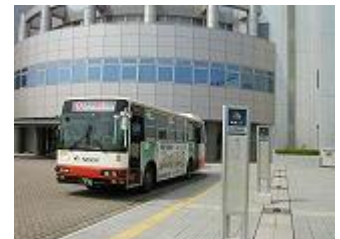
【南海バス大阪技術研前乗り場】